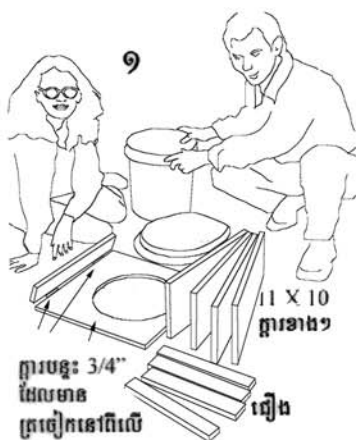
១ ក្បាលបន្ទះ 3/4" ដែលមាន ត្រចៀកនៅពីលើ