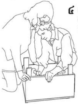
៤ ចាប់ខ្នោតជើងប្រអប់ទៅនឹងប្រអប់ សារីកម្តោះជើងប្រអប់ចុះឡើង ដើម្បីអោយដុងលយចេញតាម ប្រហោងក្បាលបន្ទះនៅខាង លើប្រហែល 1/2" ដូចដែលបានឃើញនៅ ក្នុងរូប (Figure 8.4) កន្លែងនេះជាដំណាក់កាល សំខាន់ជាទីបំផុតដែលអ្នក មិនត្រូវមើលហួសឬមិនយក ចិត្តខុកមាក់បានឡើយ។

បង្គន់ (Sawdust Toilet) ដែលមានត្រចៀកទ្វារភ្ជាប់ពីលើនឹងមានទទឹង 18" បណ្តោយ 21" នៅពេលធ្វើហើយ។ អ្នកត្រូវយកក្បាលលើបន្ទះ 3/4" X 10" X 18" ពី(2) ក្បាលលើបន្ទះ 3/4" X 10" X 19.5" ពី(2) ត្រចៀកទ្វារ ពី(2) ហើយយកក្បាលលើបន្ទះ 18" X 18" ហើយនឹង លើបន្ទះ 18" X 3" មកភ្ជាប់គ្នាដោយប្រើត្រចៀកទ្វារ។ ចោះរន្ធនៅលើក្បាលលើបន្ទះតំរាយតំល្មម នឹងមាត់ដុងទឹកដែលមានចំណុះទឹក ៥ Gallons ហើយបញ្ជូលវាប្រហែល 1" ទៅ 1-1/2" ពីខាងមុខដូចដែលបានឃើញនៅក្នុងរូប (Figure 8.4)។ យកដុងមានចំណុះទឹក 5-Gallons បួន(4)។ បន្ទាប់មកយកក្បាលលើបន្ទះ 3/4" X 3" X 12" បួន(4) សម្រាប់ធ្វើជាជើង ហើយយកគម្របបង្គន់ខ្នាតទូទៅមួយ(1)។